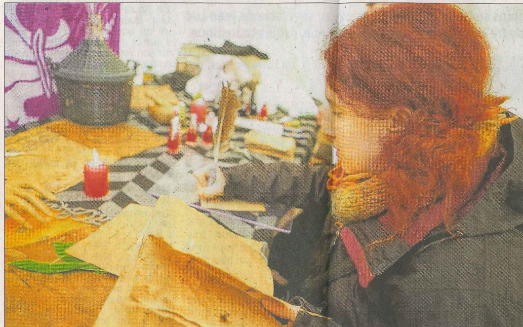
Parmi les épreuves concoctées par les organisateurs, celle du déchiffrement de recettes. Pas la plus facile.