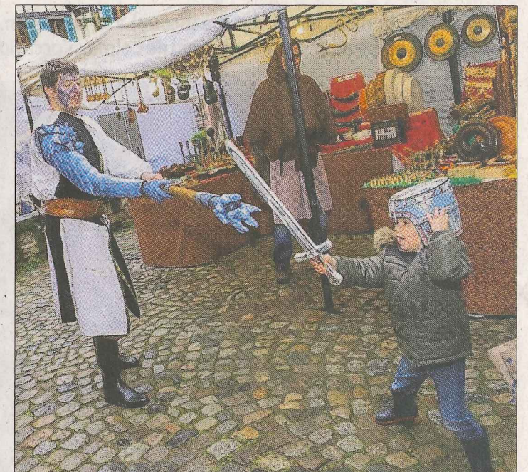
En garde, jeune chevalier !