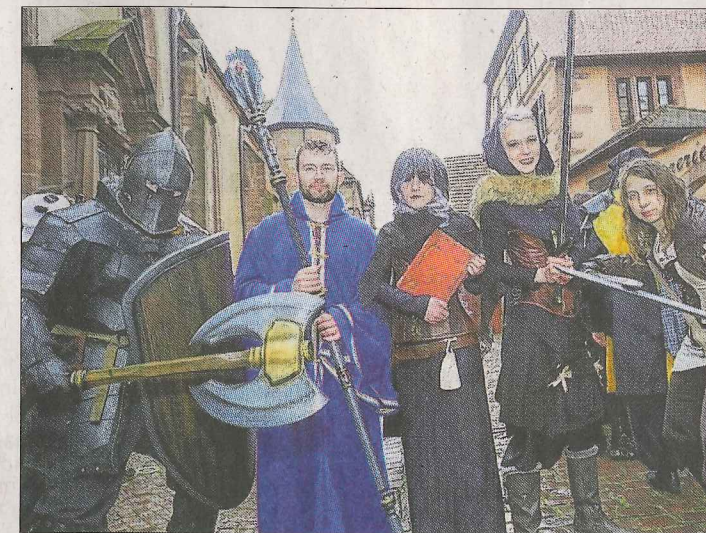
Malgré la pluie, plusieurs équipes de rôlistes ont participé hier à ce 10 e Festival du jeu de rôle organisé par l'association Nickel.